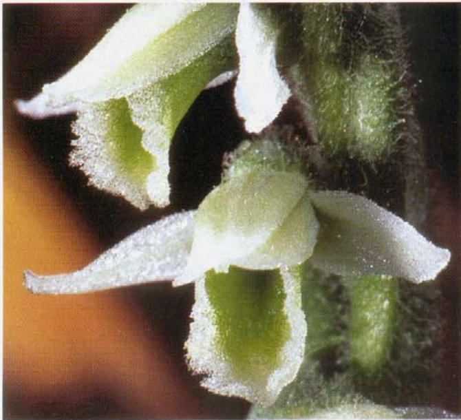
Einzelblüten von Spiranthes spiralis

Die Herbst-Drehwurz ist der Spätblüher unter unseren einheimischen Orchideen. Die Blütezeit wird je nach Wuchsort von Ende August bis sogar Anfang Oktober angegeben, scheint sich in den letzten Jahren aber deutlich vorzuverlagern.