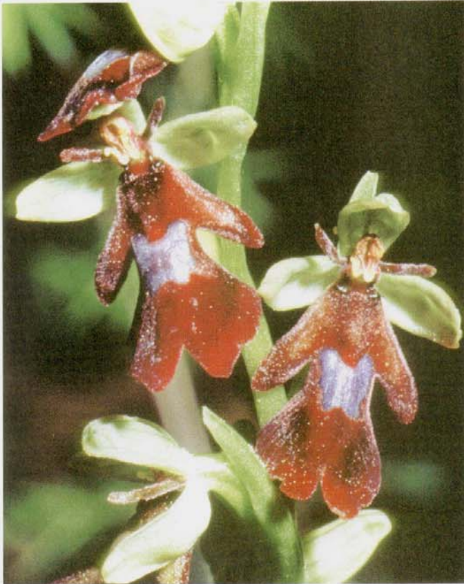
Ausschnitt aus einem Blütenstand von Ophrys insectifera

ist eine besonders raffinierte Pflanze, die zur Familie der Orchideen gehört. Die eher unscheinbare braun-grüne Pflanze mit ihrem meist blauen Mal auf der Lippe versteht es männliche Hautflügler ( Hymenoptera ) speziell die der Familie der Grabwespen ( Sphecidae ) arglistig zu täuschen. Dazu hat sie einige Strategien entwickelt, mit dem Ziel selbst bestäubt zu werden. Die Fliegen-Ragwurz ist eine eher schlanke Orchidee mit vielen kleineren (bis zu zwanzig) Einzelblüten an einem bis zu 50 Zentimeter hohen gelblich-grünen Stängel. Die Blüten zeigen den typischen Blütenaufbau der Orchideen, die Einzelblüte besteht aus sechs Blütenblättern. Auf den ersten Blick fällt ein Blütenblatt besonders auf: die längsgezogene braune sogenannte Blütenlippe mit ihrem blauen Mal und ihrer pelzigen Oberfläche. Die restlichen fünf kleineren Blütenblätter sind darüber so angeordnet, dass die Gesamtblüte auf den ersten Blick wie ein Insekt mit Fühlern aussieht. Die