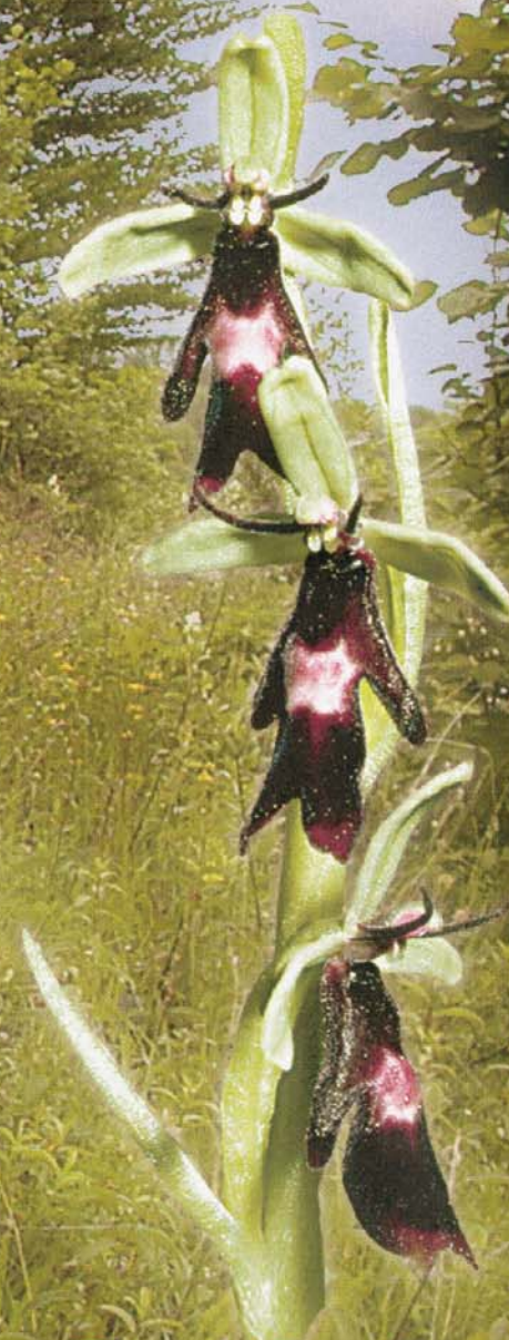
Fliegen-Ragwurz Ophrys insectifera L.