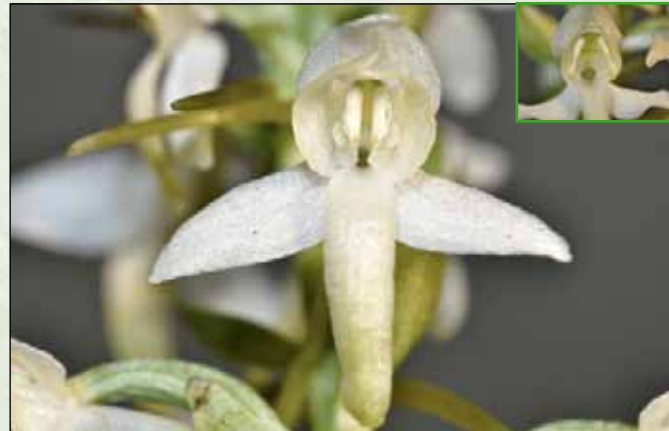
Einzelblüte Platanthera bifolia [kleines Foto: P. chlorantha ]

P. chlorantha : weit auseinander, trapezförmig angeordnet