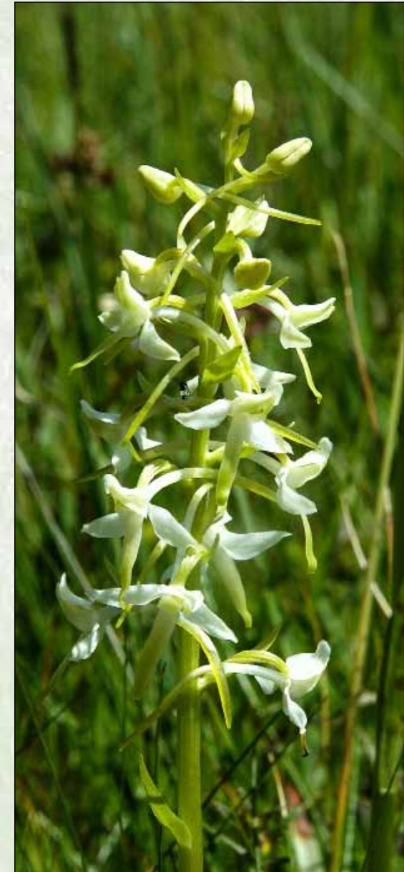
Zweiblättrige Waldhyazinthe Platanthera bifolia (L.) RICH.